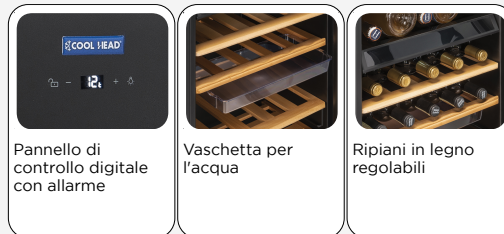
Pannello di controllo digitale con allarme